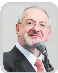
José Renato Nalini Secretário da Educação do Estado de São Paulo e docente da Uninove