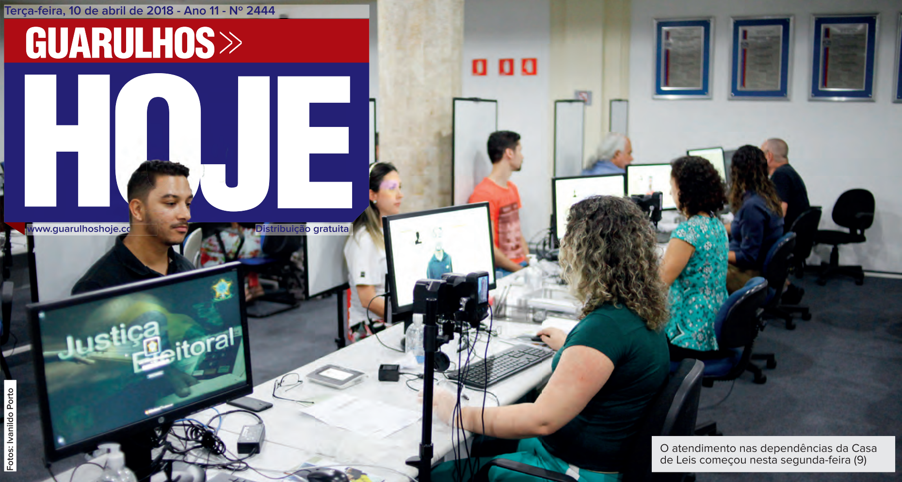
O atendimento nas dependências da Casa de Leis começou nesta segunda-feira (9)