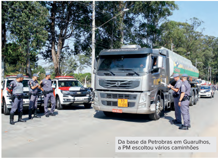
Da base da Petrobras em Guarulhos, a PM escoltou vários caminhões