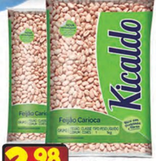
Feijão Carioca Ki Caldo 1kg