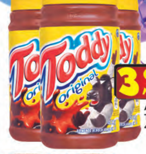
Achocolatado Tot Toddy 400g