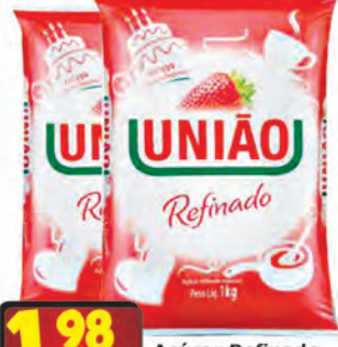
Açúcar Refinado União 1kg