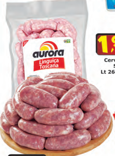
Linguiça Toscana Aurora kg