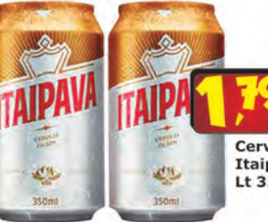
Cerveja Itaipava Lt 350ml