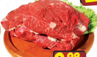
Miolo de acém c/ osso kg