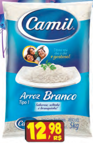
Arroz Camil Tp1 5kg