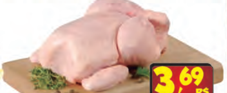
Frango Resfriado kg