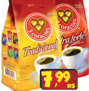
Café 3 Corações 500g