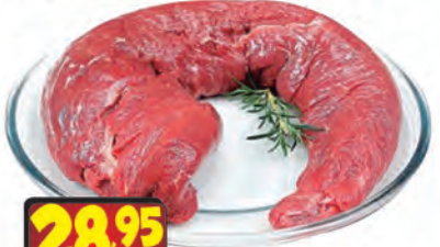
Filé Mignon Peça kg