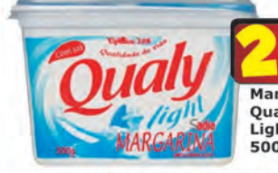
Margarina Qualy Light C/Sal 500g