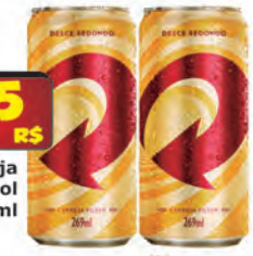
Cerveja Skol Lt 269ml