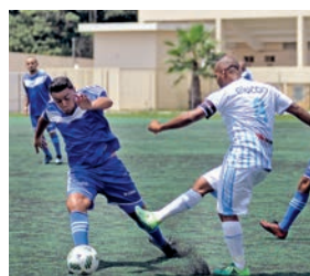
Prestígio o esporte metalúrgico

Prazo de inscrições ao 25º Campeonato de Futebol vai até 30 de setembro. Procure nossa sede, à rua Harry Simonsen, 202, Centro, com Andréia. Informações, ligue 2463.5300, 4965.9333 ou 4965.9337. Fale com um dos nossos diretores.