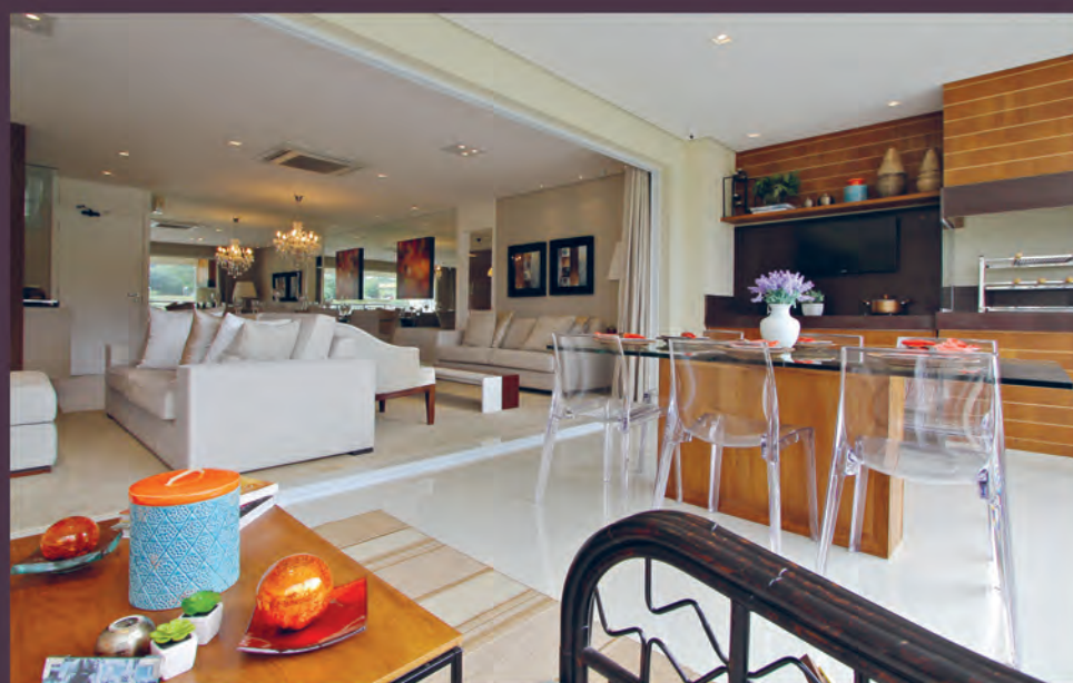
FOTO DO DECORADO

...IDADE E AGILIDADE ...PROVAÇÃO DO CRÉDITO