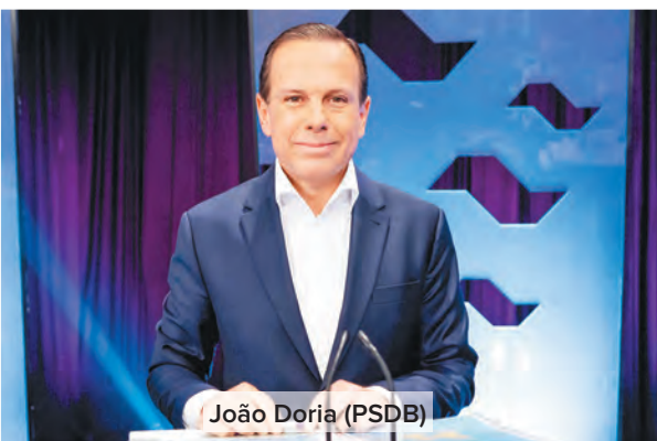
João Doria (PSDB)