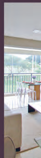
FOTO DO DECORADO