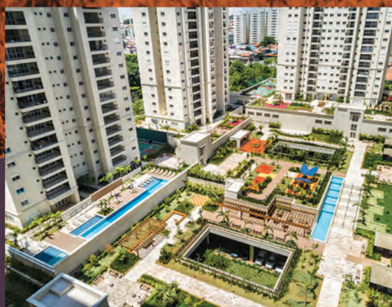
FOTO DA PRAÇA CENTRAL