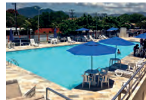
Colônia possui 38 apartamentos

Nossa secretaria recebe inscrições ao sorteio de hospedagem no Natal e no Ano Novo na Colônia de Férias, em Caragatatuba. Sócios têm até 31 de outubro pra se inscrever. Sorteio acontecerá dia 9 de novembro, às 18 horas, no auditório (rua Harry Simonsen, 202, Centro, Guarulhos).