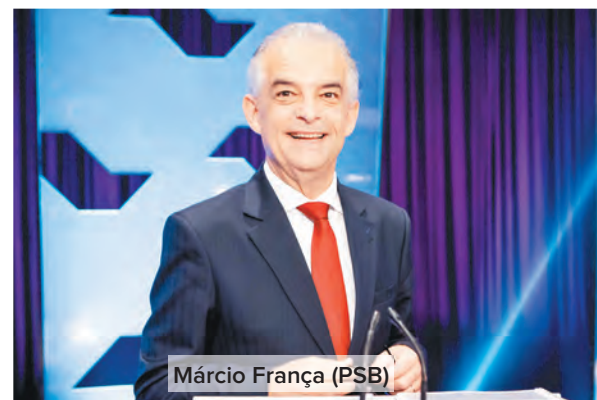
Márcio França (PSB)

A disputa pelo governo do estado de São Paulo chega embolada ao primeiro turno das eleições, neste domingo (7). O governador de São Paulo Márcio França (PSB), candidato à reeleição, vem mantendo uma trajetória ascendente nas pesquisas de intenção de voto, iniciada há um mês, e ameaça os principais adversários João Doria (PSDB) e Paulo Skaf (MDB). A cada pesquisa, França vem diminuindo a distância