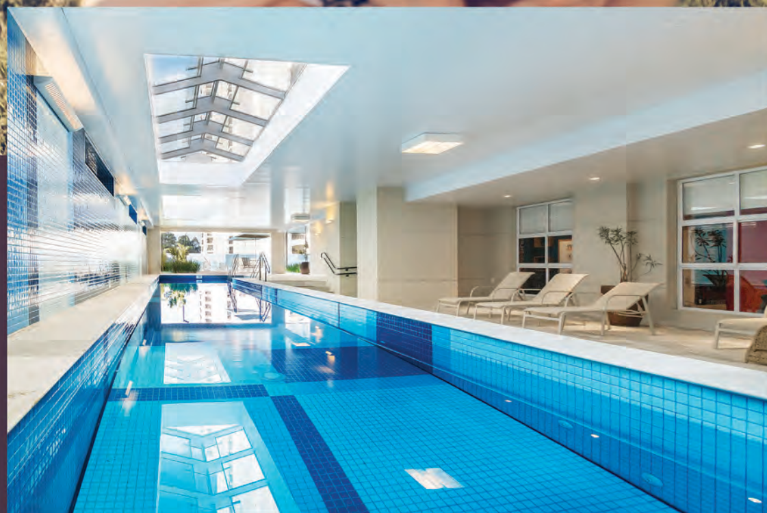
FOTO DA PISCINA - RESIDENCIAL BOTÂNICA