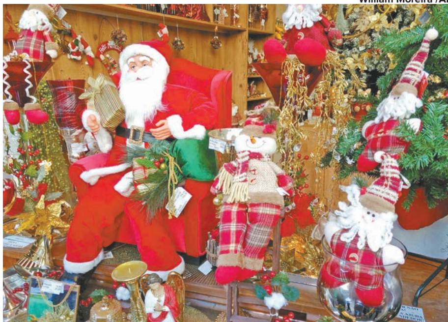
William Moreira / AE