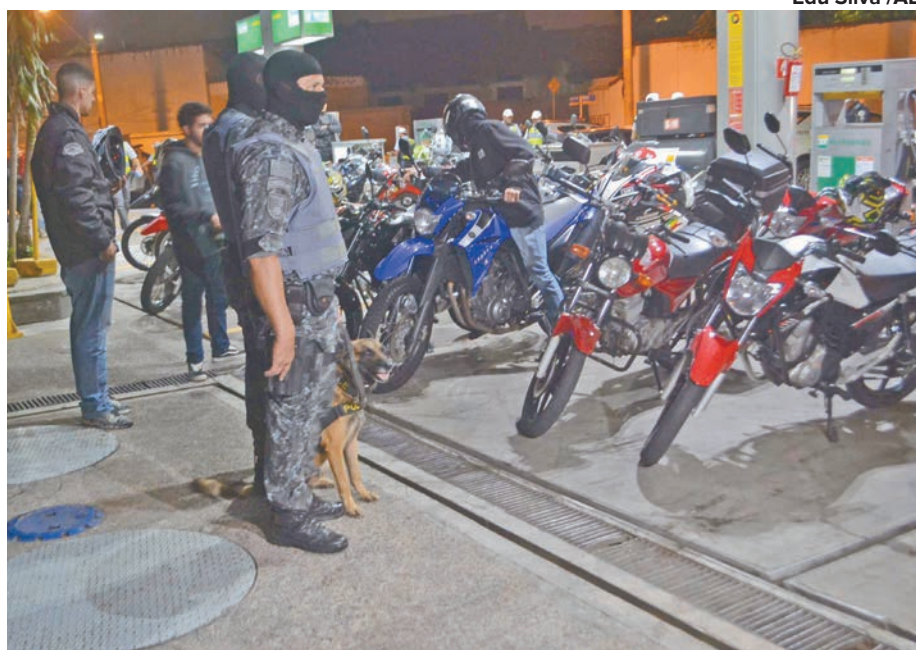
Edu Silva / AE