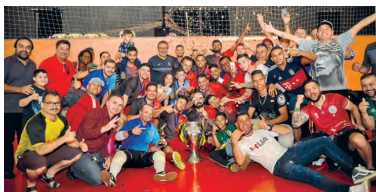
FESTA - Diretores, atletas e torcedores na comemoração do título

A final domingo, dia 21, foi emocionante. A vitória sobre a Granei (Taboão) veio nos pênaltis (5 a 4), após empate em 3 a 3 no tempo normal.