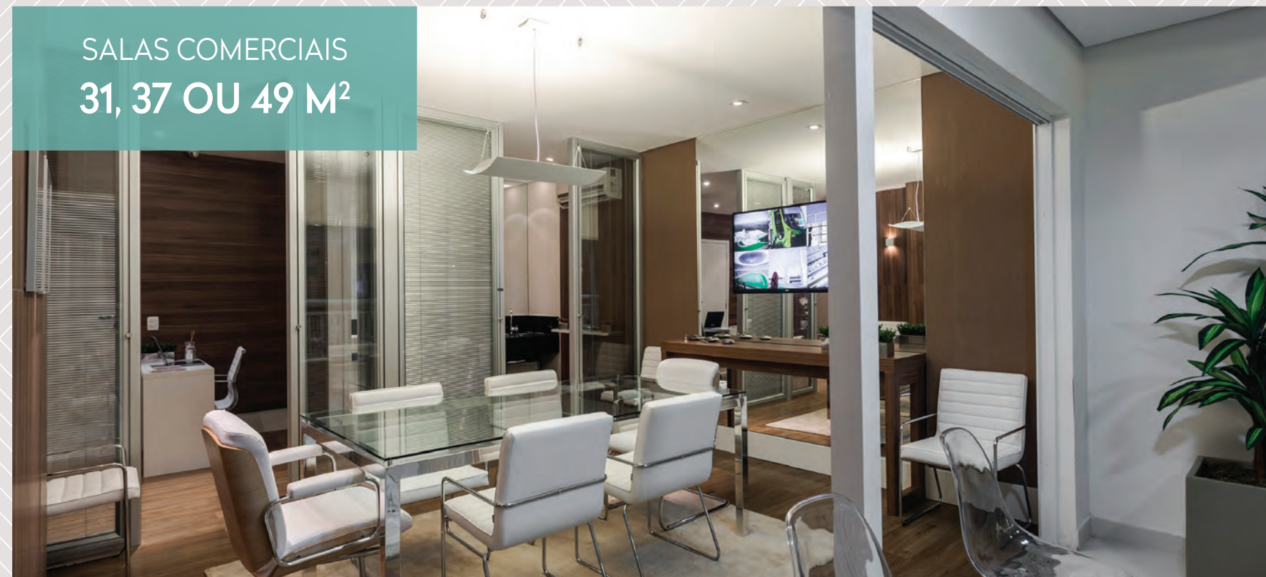
Foto do studio de 37 m 2 do Via Alameda Studios com sugestão de decoração