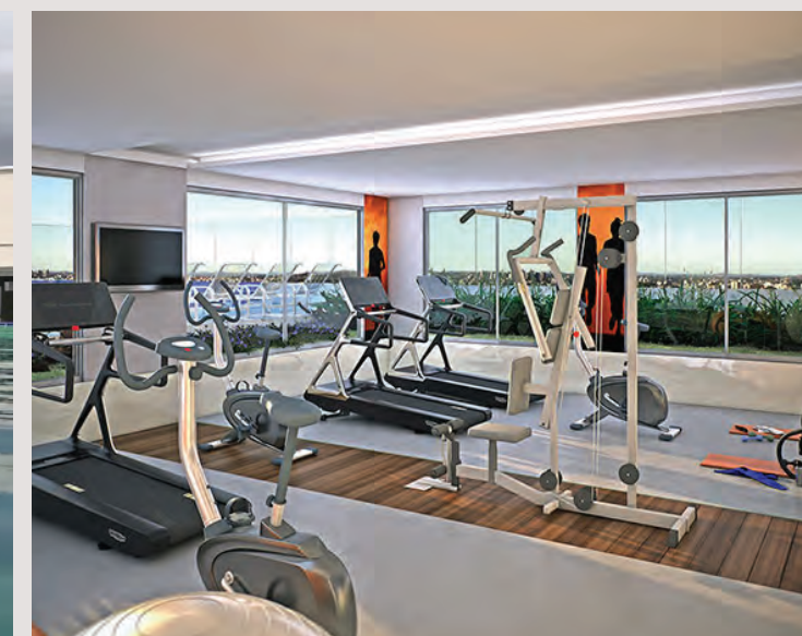
Perspectiva artística do espaço fitness