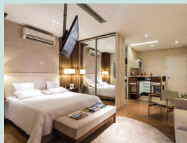
Perspectiva artística do living