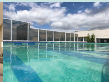
Foto da piscina