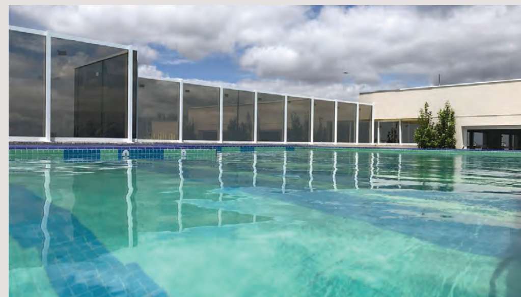
Foto da piscina