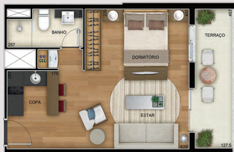
Perspectiva artística da planta-tipo de 37 m 2