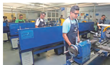
Aulas práticas aprimoram o aluno

A Escola Data Brasil está com inscrições abertas para cursos profissionalizantes. Na próxima semana, o estabelecimento faz sua Black Week, com descontos especiais. A Data Brasil é escola parceira do Sindicato. Está localizada à Harry Simonsen, 188, Centro (ao lado de nossa sede). Para mais informações, ligue 2440.6000.