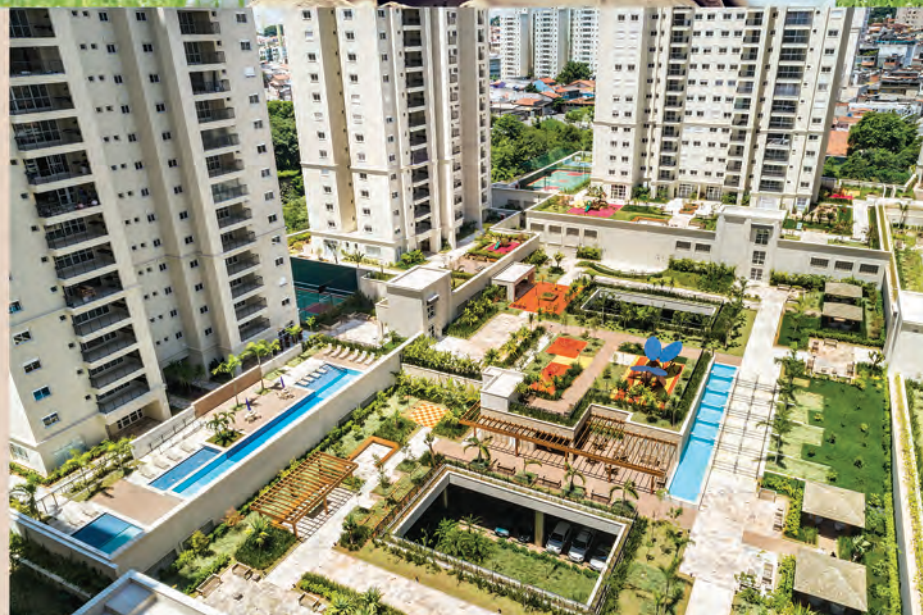
FOTO DA PRAÇA CENTRAL