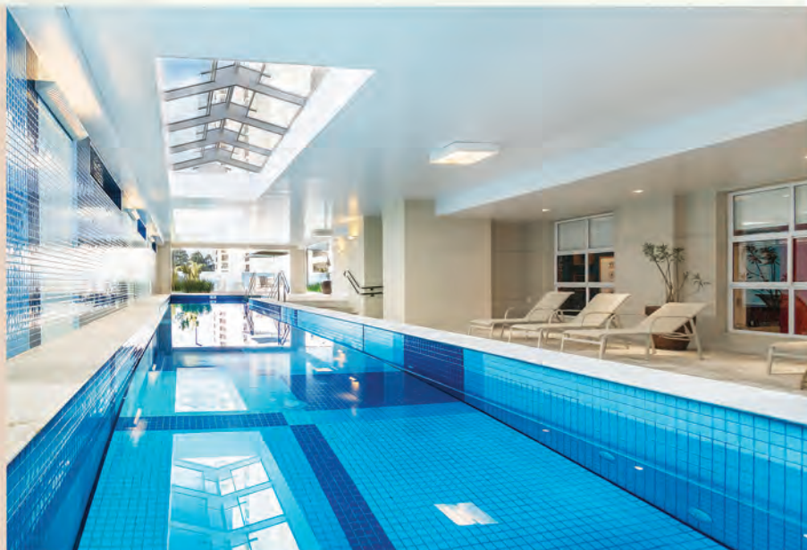
FOTO DA PISCINA - RESIDENCIAL BOTÂNICA