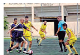
Competição mobiliza categoria

Sábado (1º), jogam Phaynell x Marília (9 horas) e Reydel x Julio Simões (10h30). Domingo (2), Golin x Truckvan (9 horas), Roda de Ouro x Steel-Rol (10h30) e Komatsu x Rod-Car (12 horas). Entrada grátis.