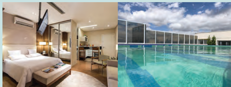
Perspectiva artística do living

SALAS COMERCIAIS 31, 37 OU 49 M 2 - 1 VAGA