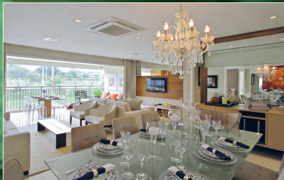
FOTO DO DECORADO

O que você precisa está à sua volta: um grande shopping, acesso a São Paulo, natureza e muito lazer. Cidade Maia é a opção perfeita para quem mora em Guarulhos e para quem está nas zonas Leste e Norte, já que possui mais qualidade de vida e o preço do m 2 mais acessível.