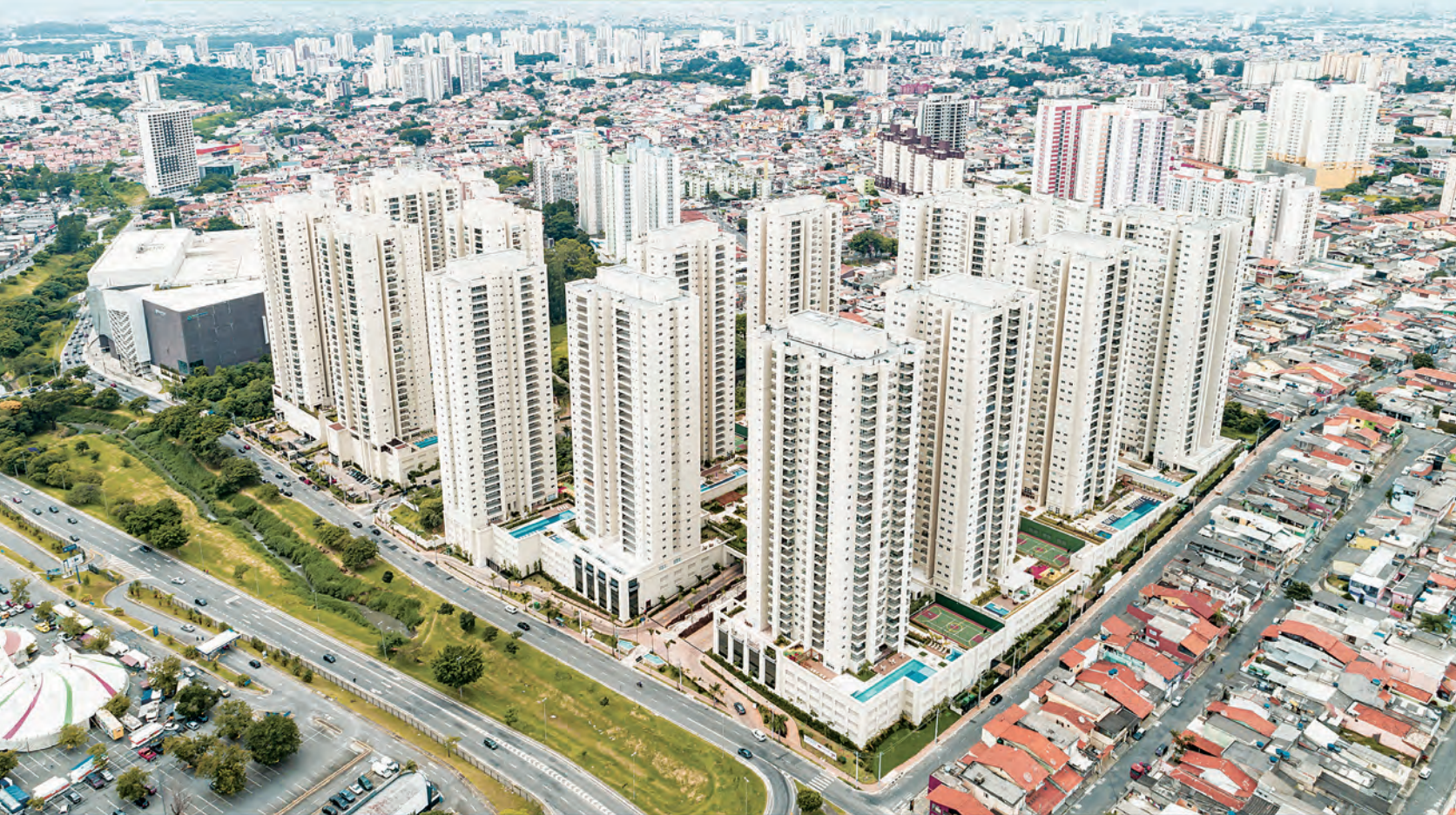
FOTO AÉREA DA REGIÃO