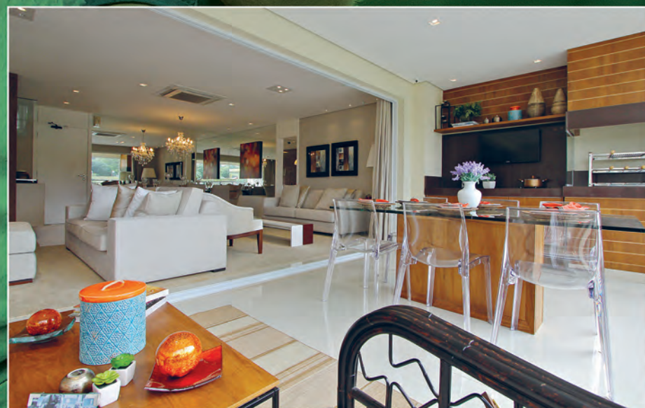
FOTO DO DECORADO