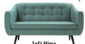
Sofá Mimo 2 lugares R$ 1.299,99 (várias cores)