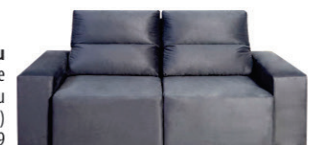
Sofá Mimo 3 lugares R$ 1.799,99 (várias cores)

*Promoções válidas até durarem os estoques. Fotos meramente ilustrativas.