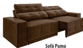
Sofá Puma Cinza / Grafite / Marrom / Preto (2,30m largura) R$ 1.199,99