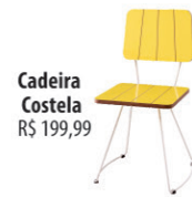
Cadeira Costela R$ 199,99