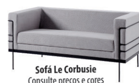
Sofá Le Corbusie Consulte preços e cores