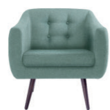
Poltrona Mimo R$ 999,99 (várias cores)