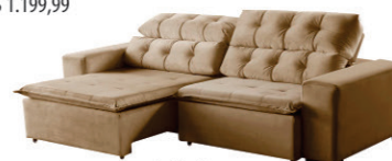
Sofá Alasca Cinza / Bordo / Caramelo (2,50m largura) R$ 2.199,99