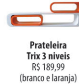
Prateleira Trix 3 níveis R$ 189,99 (branco e laranja)