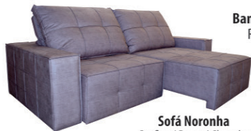
Sofá Noronha Grafite / Bege / Chumbo (2,30m largura) R$ 2.799,99