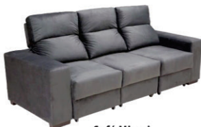
Sofá Miami Retrátil e articulado (220 cm de largura) R$ 999,99