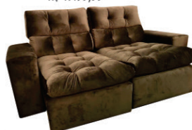
Estofado Manchester Marrom / Cinza / Caramelo (2,00m largura) R$ 1.499,99