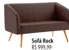
Sofá Rock R$ 999,99