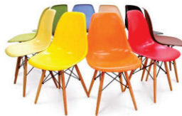
Cadeira Eiffel R$ 139,99 (várias cores)