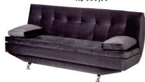
Sofá Salette Velvetten Cacau / Grafite / Marinho (1,90m largura) R$ 999,99