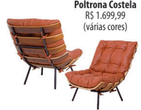
Poltrona Costela R$ 1.699,99 (várias cores)