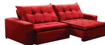
Sofá Paris Bege / Caramelo / Cinza / Preto (3,50m largura) R$ 2.799,99