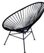
Cadeira Acapulco R$ 349,99 (várias cores)