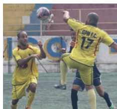
Jogos começam às 9 horas

Após um reinício eletrizante, o Campeonato de Futebol segue hoje e amanhã. A rodada terá cinco partidas. Sábado: Marília e Julio Simões; Feeder e Phaynel. Domingo: Modine e Rod-Car; U-Shin e Dyna; Cerviflan e União Metalúrgica. Prestígio!