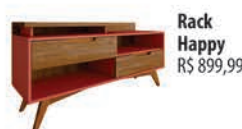
Rack Happy R$ 899,99