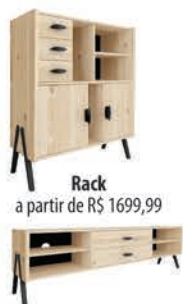
Rack a partir de R$ 1699,99