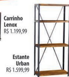
Estante Urban R$ 1.599,99