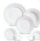
Pratos a partir de R$ 9,99