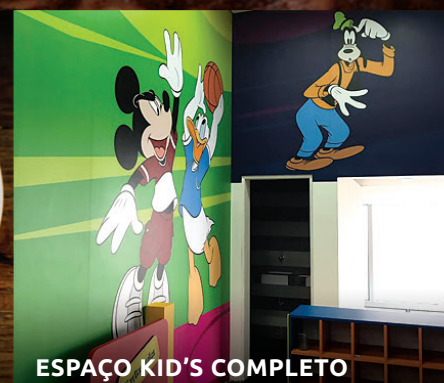
ESPAÇO KID'S COMPLETO

A melhor opção para o seu almoço de domingo!