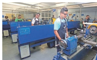
Aulas em modernos laboratórios

Inscrições à rua Harry Simonsen, 188, Centro (ao lado da sede). De segunda a sexta, das 9 às 20 horas; sábados, das 9 às 16 horas. Para mais informações, ligue no 2440.6000.