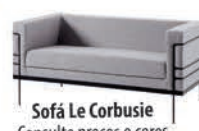
Sofá Le Corbusie Consulte preços e cores