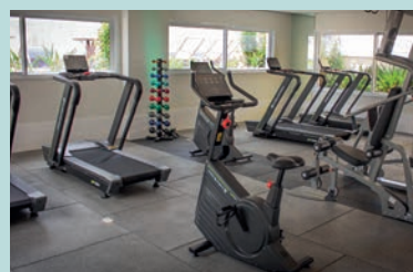
Foto do espaço fitness