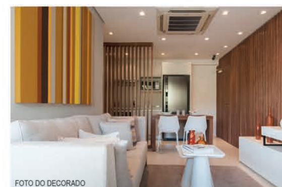
FOTO DO DECORADO

(***) O APTO. DE 38 M 2 NÃO POSSUI SUÍTE.