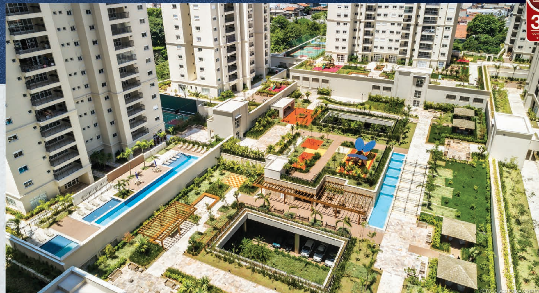
FOTO DO VOU PRAÇA CENTRAL