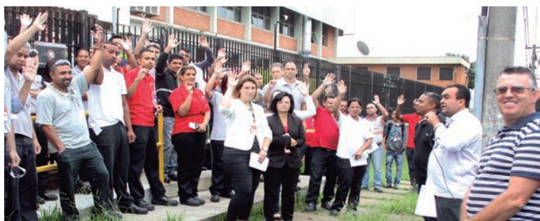
APROVAÇÃO - Assembleia aprova proposta apresentada pelos nossos diretores

"Mesmo em meio à crise que o País enfrenta, conseguimos um benefício com valor que está entre os