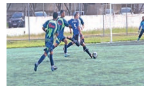
Jogos são disputados no Clube

O Campeonato de Futebol terá rodada decisiva domingo (10). Serão três jogos no Clube de Campo (Parque Primavera), que definirão mais três classificados à próxima fase. A partir das 9 horas, jogam U-Shin x Elecon, Golin x União Metalúrgica e Feeder x Jomarca. Já estão classificados Steel Rol, Rod-Car e Julio Simões. Entrada grátis.