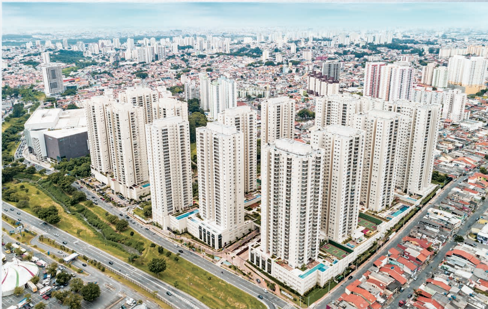
FOTO AÉREA DA REGIÃO

VISITE A CENTRAL DE ATENDIMENTO AV. PAULO FACCINI, 1.467 - GUARULHOS • 11 3135-5151