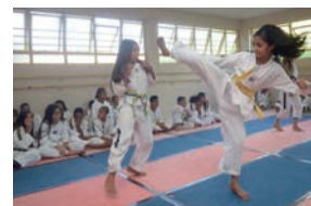
Esporte agrega e socializa

Crianças e jovens carentes atendidos pelo Instituto Cultural e Esportivo Meu Futuro, idealizado e mantido pelo Sindicato, voltam às atividades dia 18.