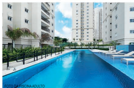
FOTO DA PISCINA ADULTO

122 A 154 M 2 PRIVATIVOS COM CHURRASQUEIRA 1