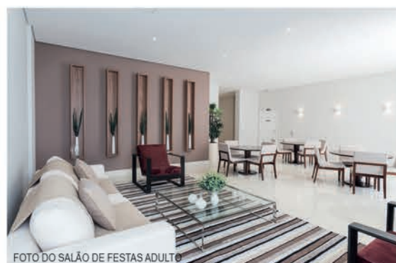
FOTO DO SALÃO DE FESTAS ADULTO

68, 86 E 106 M 2 PRIVATIVOS COM CHURRASQUEIRA 1 E SUÍTE