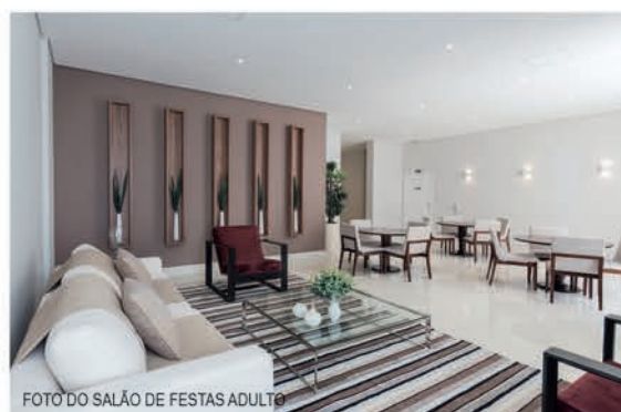
FOTO DO SALÃO DE FESTAS ADULTO

68, 86 E 106 M 2 PRIVATIVOS COM CHURRASQUEIRA 1 E SUÍTE