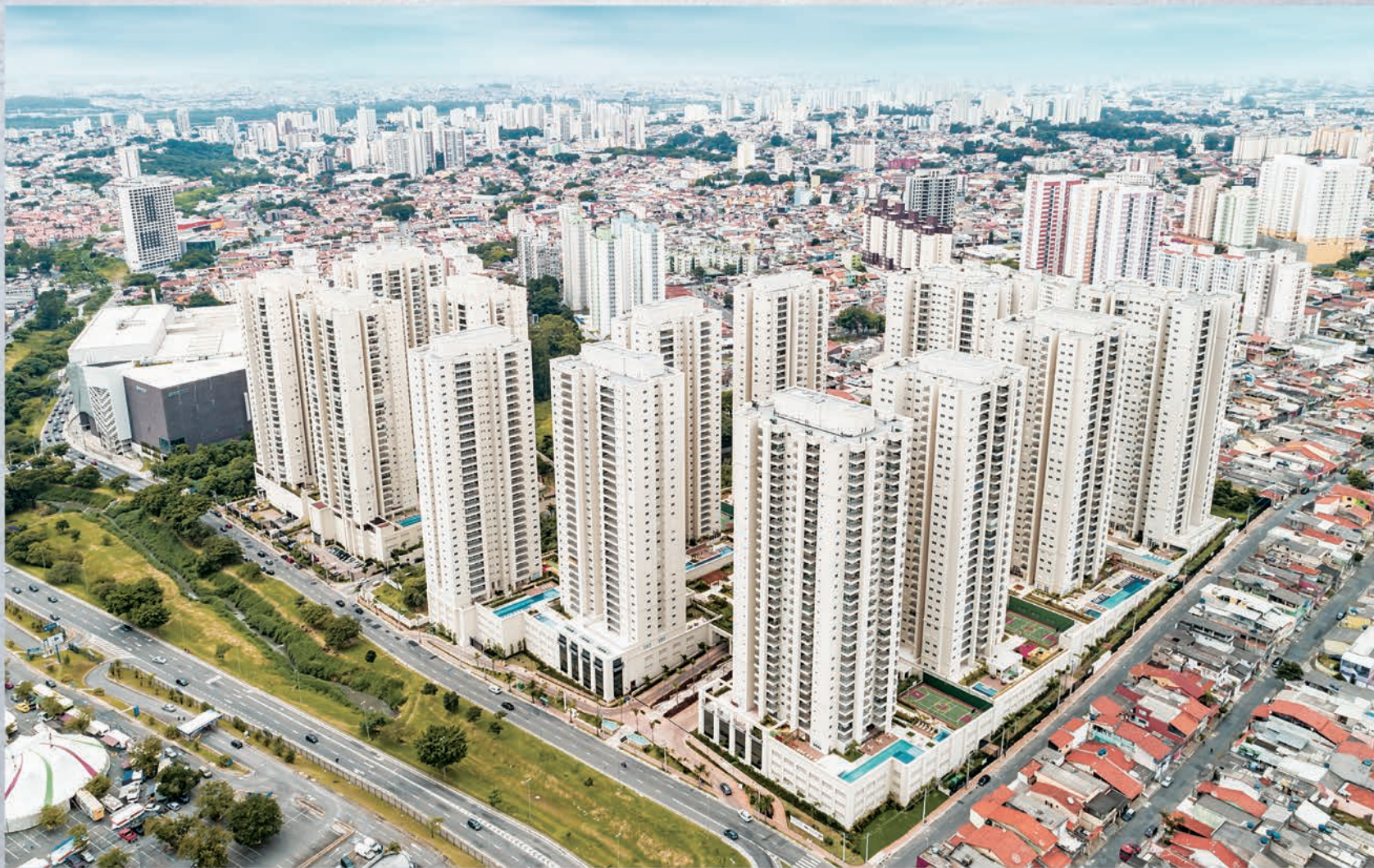
FOTO AÉREA DA REGIÃO