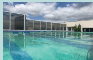
Foto da piscina

VISITE OS DECORADOS E O EXCLUSIVO ROOFTOP.