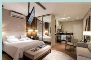
Foto do studio de 37 m 2