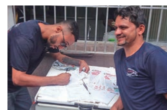
Novos associados na Projinox

A campanha de sindicalização chega a mais fábricas da base. A adesão da categoria é muito boa.