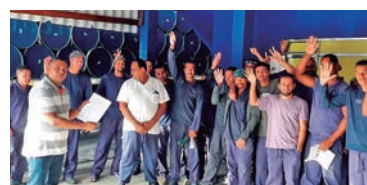
Fala Mansa apresenta proposta na empresa

Ação do Sindicato garantiu avanços para os 25 funcionários da Uniflex (Nova Bonsucesso). A empresa pertence ao Grupo 10 patronal.