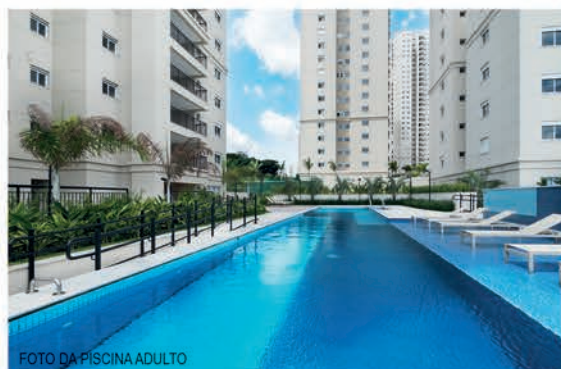
FOTO DA PISCINA ADULTO

122 A 154 M 2 PRIVATIVOS COM CHURRASQUEIRA 1