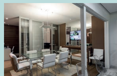
Foto da sala comercial de 75 m 2