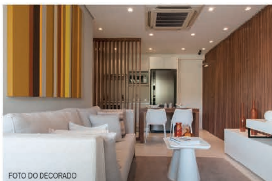
FOTO DO DECORADO

(***) O APTO. DE 38 M 2 NÃO POSSUI SUÍTE.