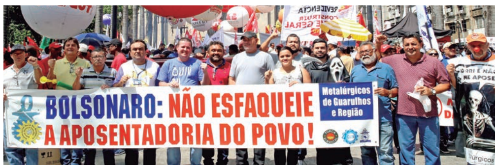
FACADA - Faixa denuncia mais uma facada na classe trabalhadora. Praça da Sé, dia 20

O evento reuniu 10 mil pessoas para repudiar o projeto de reforma previdenciária de Bolsonaro. Ela retarda aposentadorias, privatiza a Seguridade e reduz benefícios dos mais pobres.