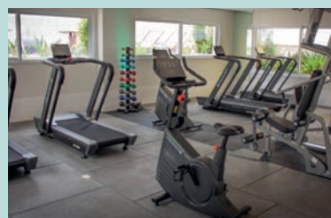
Foto do espaço fitness