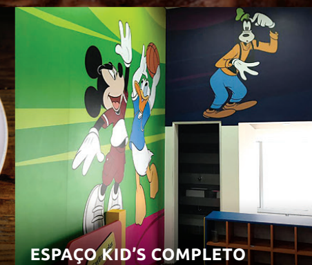
ESPAÇO KID'S COMPLETO

A melhor opção para o seu almoço de domingo!