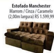
Estofado Manchester Marrom / Cinza / Caramelo (2,00m largura) R$ 1.599,99