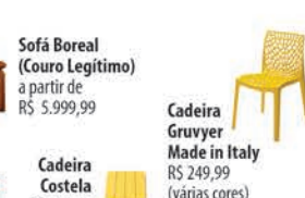
Sofá Boreal (Couro Legítimo) a partir de R$ 5.999,99