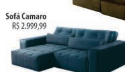
Sofá Camaro R$ 2.999,99