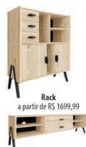
Rack a partir de R$ 1699,99