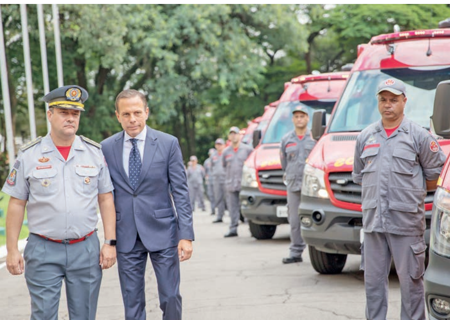
Governo de São Paulo

dos modelos Sprinter (Mercedes Benz), que serão utilizadas no trabalho terrestre do resgate. Os outros dez veículos – seis Unidades de Suporte Avançado, dois caminhões do tipo rollon/rolloff, uma van e uma picape – serão usados em casos mais graves e no transporte de medicamentos, alimentos, roupas, barracas e outros materiais, bem como dos profissionais.