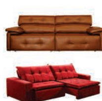
Sofá Paris Bege / Caramelo / Cinza / Preto (3,05m largura) R$ 2.899,99