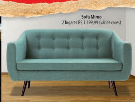
Sofá Mimo 2 lugares R$ 1.199,99 (várias cores)