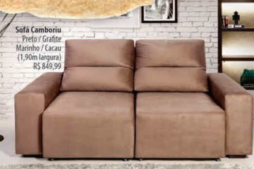
Sofá Camboriu Preto / Grafite Marinho / Cacao (1,90m largura) R$ 849,99