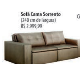
Sofá Cama Sorrento (240 cm de largura) R$ 2.999,99