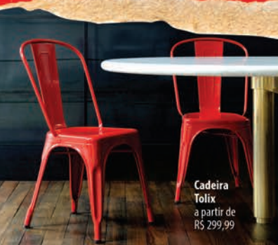
Cadeira Tolix a partir de R$ 299,99