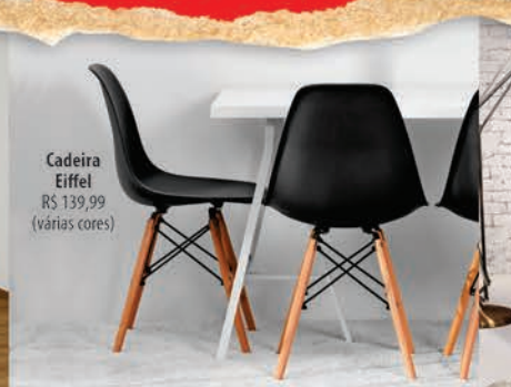
Cadeira Eiffel R$ 139,99 (várias cores)