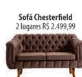
Sofá Chesterfield 2 lugares R$ 2.499,99