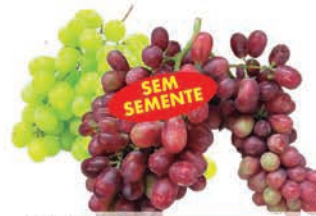
Uva Crinson/ Thompson Band. 500g