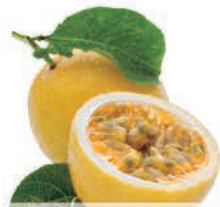
Maracujá Azedo kg