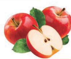
Maçã Gala kg