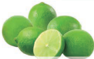
Limão Taiti kg