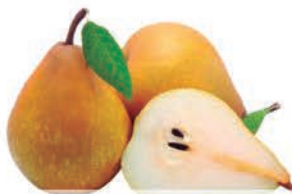
Pêra Portuguesa kg