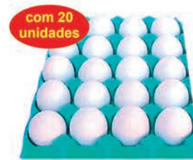
Ovos Brancos Bandeja c/ 20 Unid.