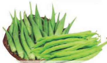
Quiabo/ Vagem 100g