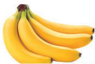
Banana Nanica kg