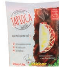
Tapioca Okker 1kg