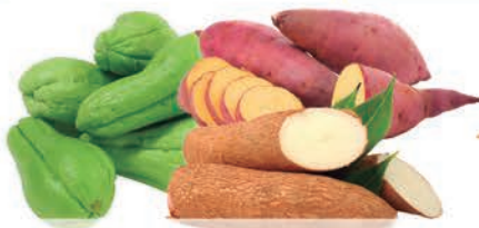
Chuchu/ Mandioca/ Batata Doce Rosada kg