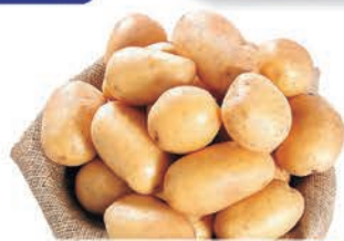
Batata Lavada kg