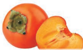
Caqui Rama Forte kg