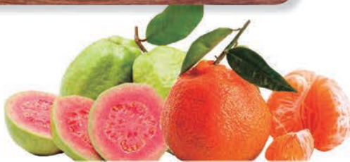
Goiaba Vermelha/ Mexerica Ponkan kg