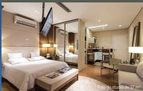
Foto do estúdio de 37 m 2