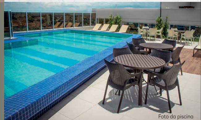
Foto da piscina

SALAS COMERCIAIS 31, 37 ou 49 M 2 – 1 VAGA CONJUNTOS DE ATÉ 854 M 2