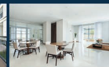
FOTO DO SALÃO DE FESTAS