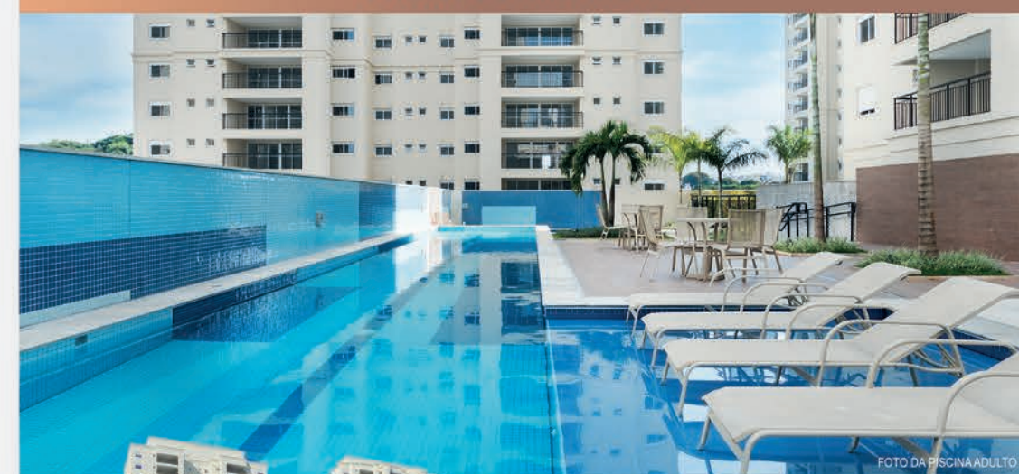
FOTO DA PISCINA ADULTO