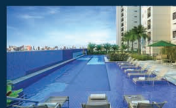
PERSPECTIVA DA PISCINA ADULTO