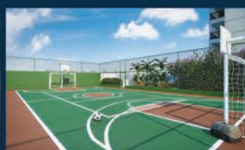
PERSPECTIVA ILUSTRADA DA QUADRA