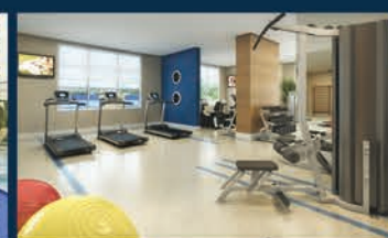
PERSPECTIVA ILUSTRADA DO FITNESS