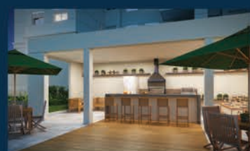
PERSPECTIVA ILUSTRADA DA CHURRASQUEIRA

UTILIZE SEU FGTS JUROS A PARTIR DE 10% AO ANO ***