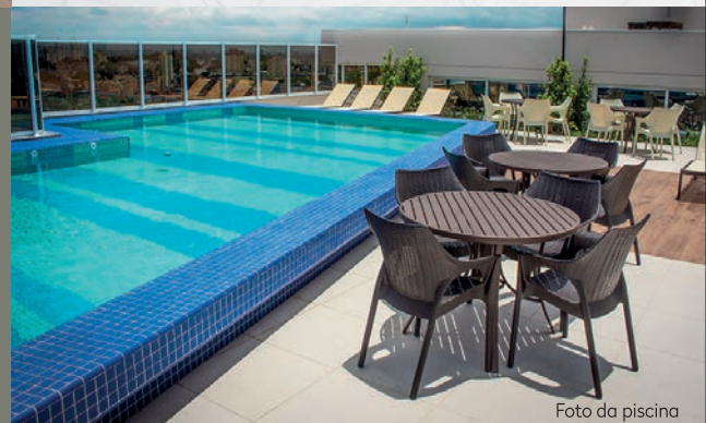
Foto da piscina

VISITE OS DECORADOS E O EXCLUSIVO ROOFTOP.