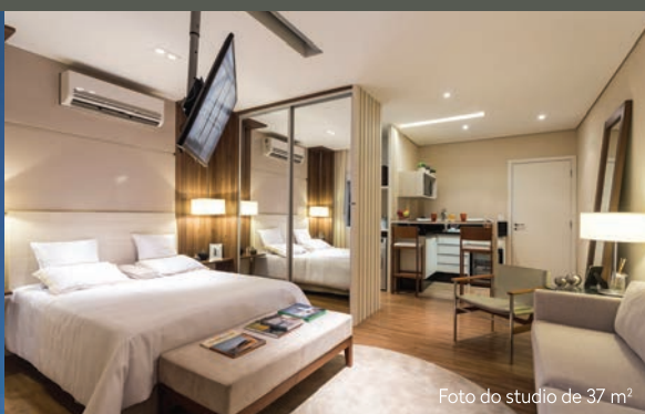
Foto do estúdio de 37 m²