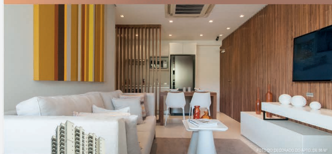
FOTO DO DECORADO DO APTO. DE 38 M 2