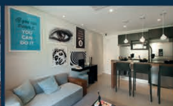
FOTO DO DECORADO DO APTO. DE 38 M 2