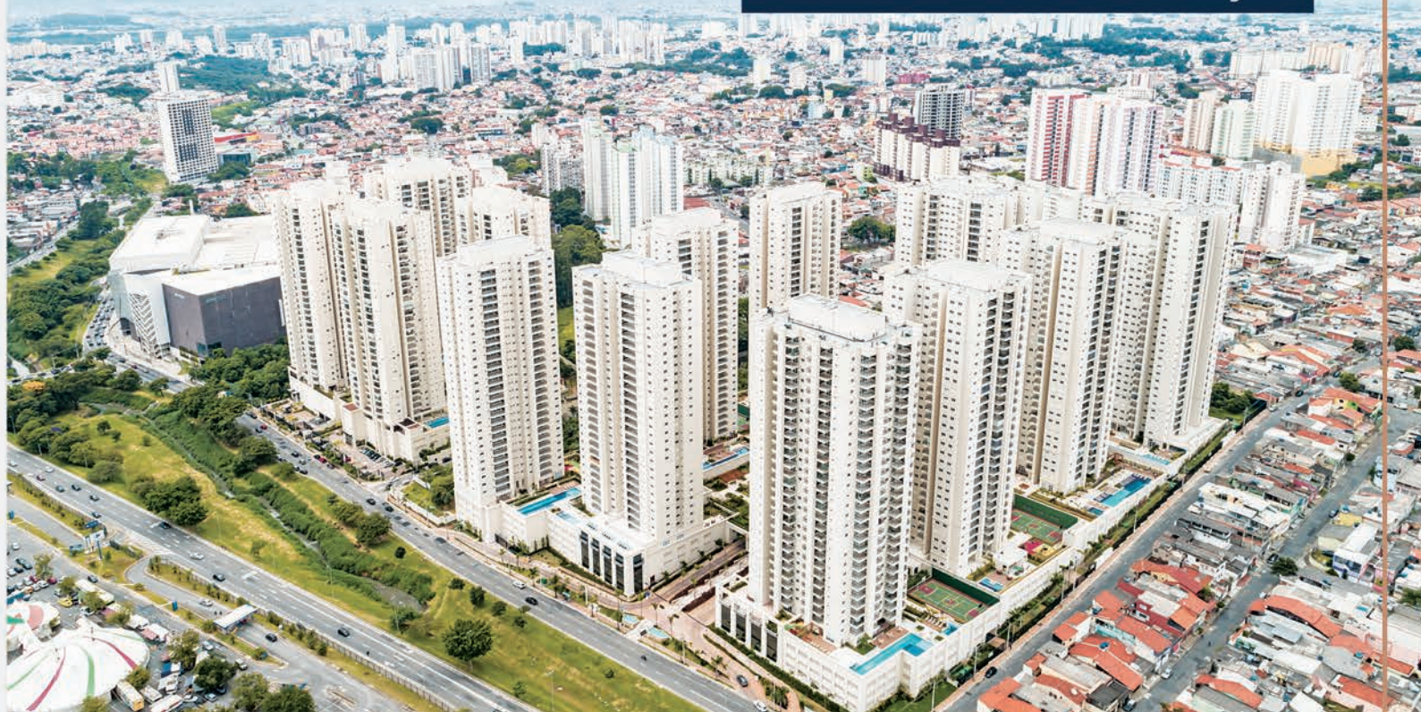
FOTO AÉREA DA REGIÃO

MUITO MAIS QUALIDADE DE VIDA, PELO MELHOR PREÇO.