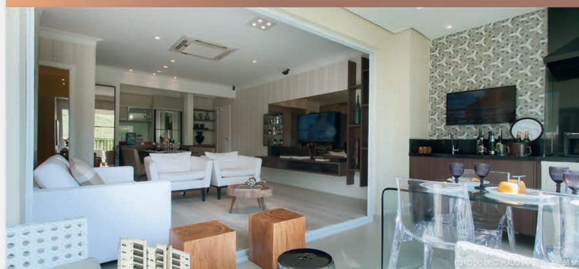
FOTO DO DECORADO DO APTO. DE 68 M 2