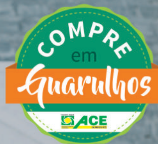
TABELA DIFERENCIADA NOS CONVÊNIOS UNIMED GUARULHOS.