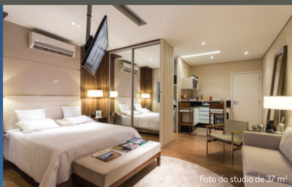
Foto do estúdio de 37 m²