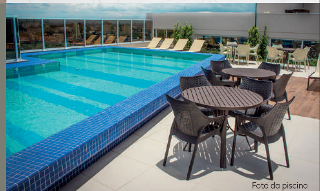
Foto da piscina

VISITE OS DECORADOS E O EXCLUSIVO ROOFTOP.