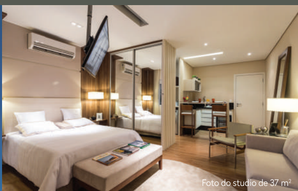
Foto do estúdio de 37 m²