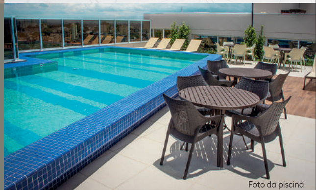
Foto da piscina

SALAS COMERCIAIS 31, 37 ou 49 M 2 – 1 VAGA CONJUNTOS DE ATÉ 854 M 2