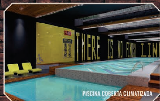
PISCINA COBERTA CLIMATIZADA