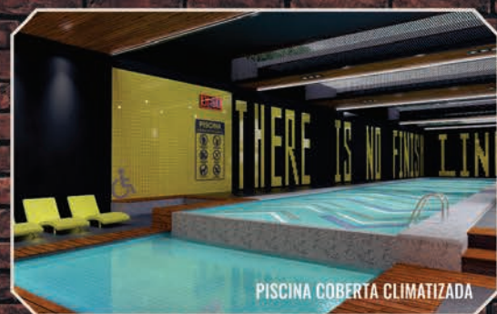
PISCINA COBERTA CLIMATIZADA

VISITE APARTAMENTOS DECORADOS! RUA SANTA IZABEL, 609 - VILA AUGUSTA - GUARULHOS