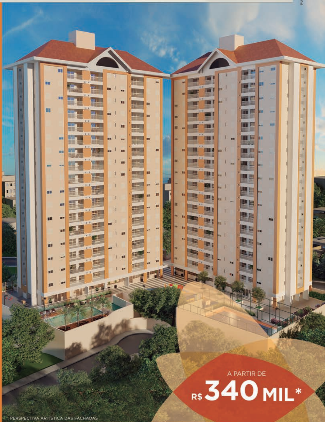
PERSPECTIVA ARTÍSTICA DAS FACHADAS