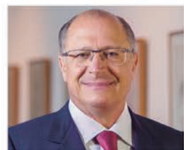
DR. GERALDO ALCKMIN Presidente Nacional do PSDB e ex-Governador do Estado de SP