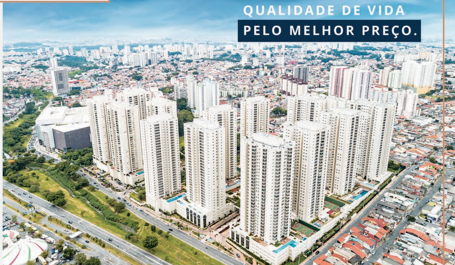
FOTO AÉREA DA REGIÃO

MUITO MAIS QUALIDADE DE VIDA PELO MELHOR PREÇO.