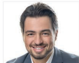
GUSTAVO HENRIC COSTA (GUTI) Prefeito da Cidade de Guarulhos