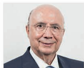
DR. HENRIQUE MEIRELLES Secretário de Estado da Fazenda e Planejamento de São Paulo

Local: Centro de Convenções Hotel Monaco, Rua Diogo Farias, 137 - Guarulhos - SP/Brasil