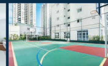
FOTO DA QUADRA