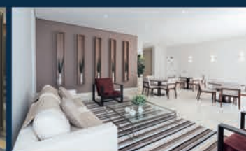
FOTO DO SALÃO DE FESTAS