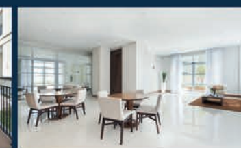
FOTO DO SALÃO DE FESTAS