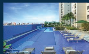
PERSPECTIVA ILUSTRADA DA PISCINA ADULTO

UTILIZE SEU FGTS JUROS A PARTIR DE 10% AO ANO***