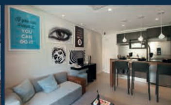
FOTO DO DECORADO DO APTO. DE 38 M 2