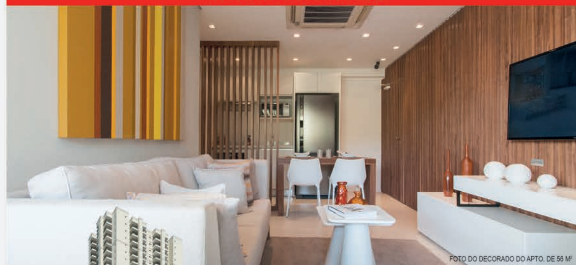
FOTO DO DECORADO DO APTO. DE 56 M 2