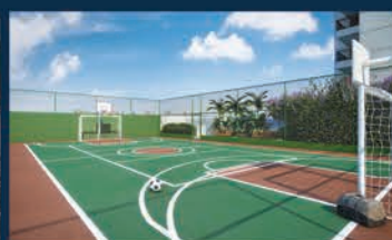
PERSPECTIVA ILUSTRADA DA QUADRA