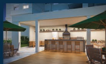
PERSPECTIVA ILUSTRADA DA CHURRASQUEIRA

UTILIZE SEU FGTS JUROS A PARTIR DE 10% AO ANO***