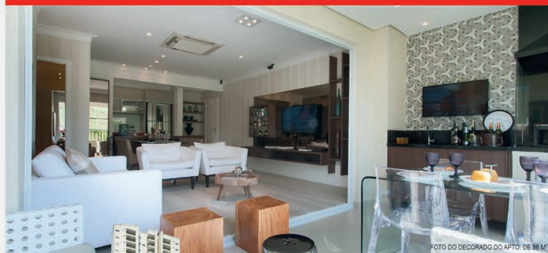
FOTO DO DECORADO DO APTO. DE 86 M 2