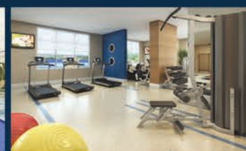
PERSPECTIVA ILUSTRADA DO FITNESS