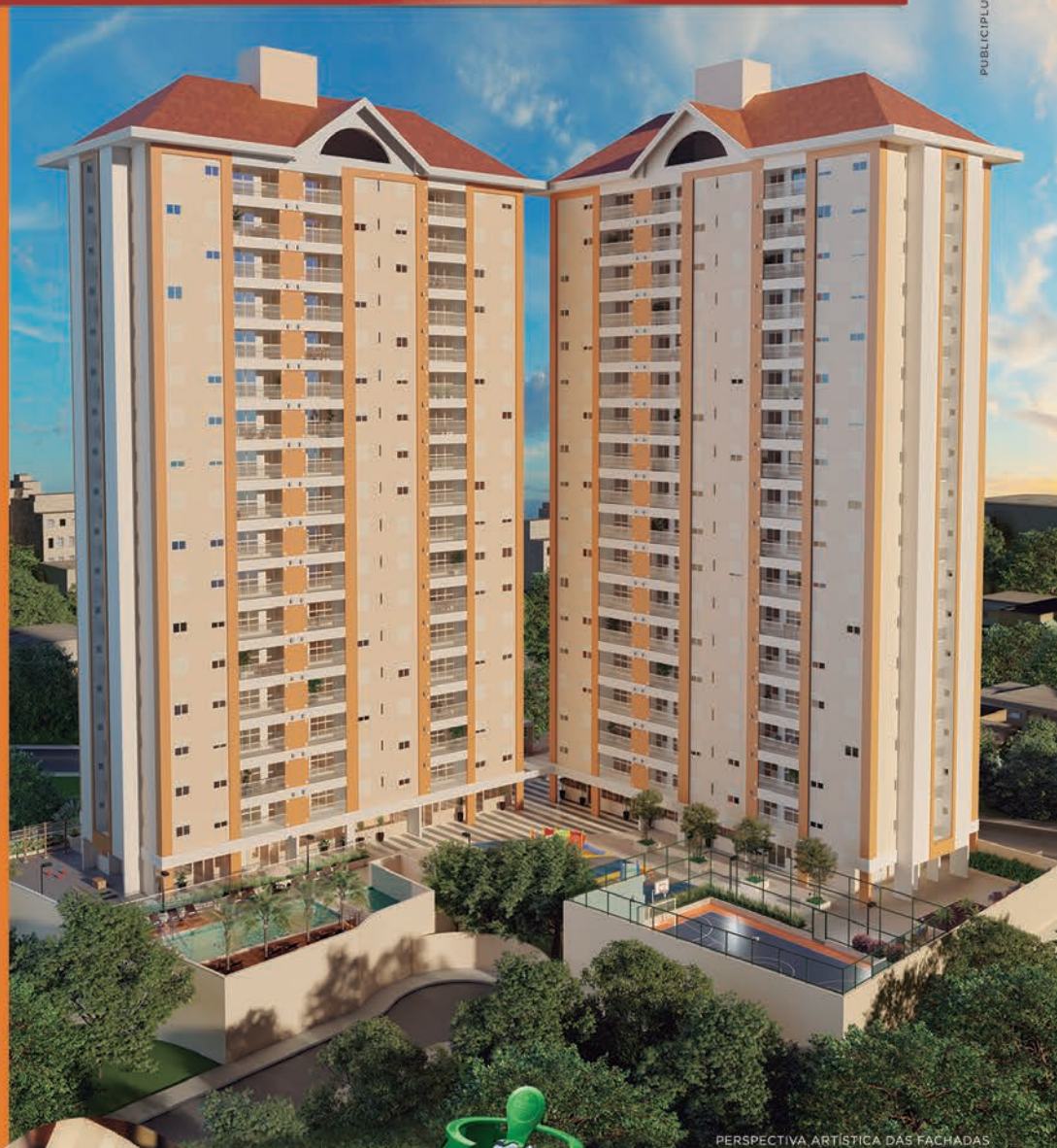
PERSPECTIVA ARTÍSTICA DAS FACHADAS

E MAIS: AO VISITAR O DECORADO, VOCÊ GANHA UM BARRIL HEINEKEN.*