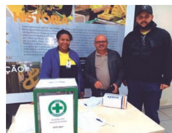
Diretor Jau acompanha a eleição