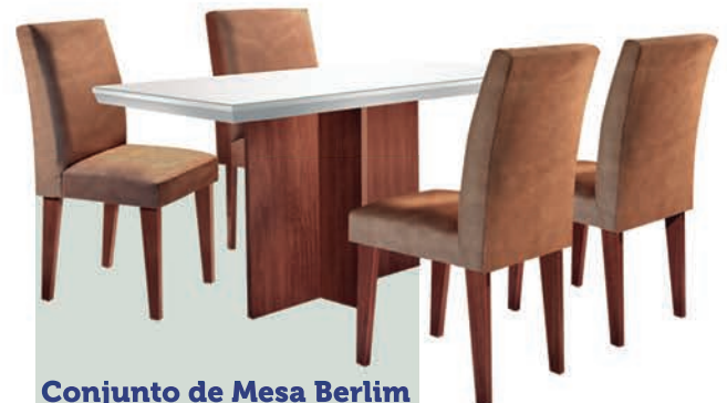
Conjunto de Mesa Berlim 120 cm com 4 Cadeiras