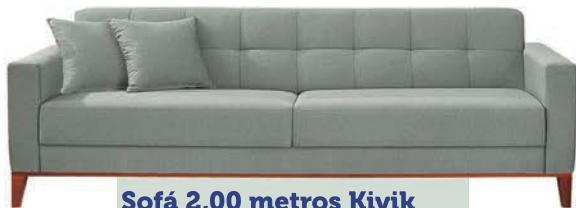
Sofá 2,00 metros Kivik