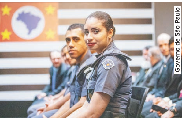
Governo de São Paulo

O governador João Doria e o secretário da Segurança Pública, general João Camilo Pires de Campos, homenagearam nesta quarta-feira (12) integrantes das polícias Civil, Militar e Técnico-Científico com o certificado Policial Nota 10. A cerimônia foi realizada na sede do governo de São Paulo, no Palácio dos Bandeirantes.