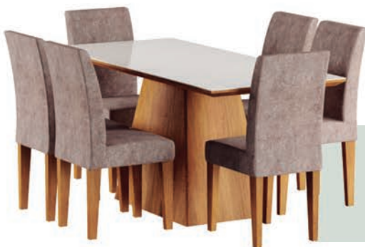
Conjunto de Mesa Luna 180 cm com 6 Cadeiras