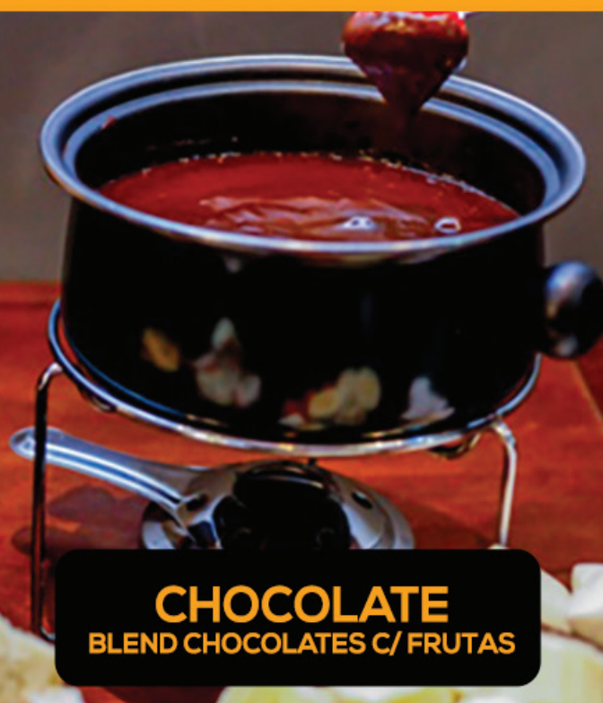
CHOCOLATE BLEND CHOCOLATES C/ FRUTAS