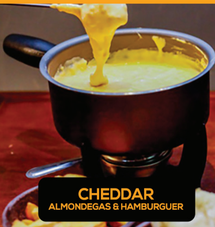
CHEDDAR ALMONDEGAS & HAMBURGUER