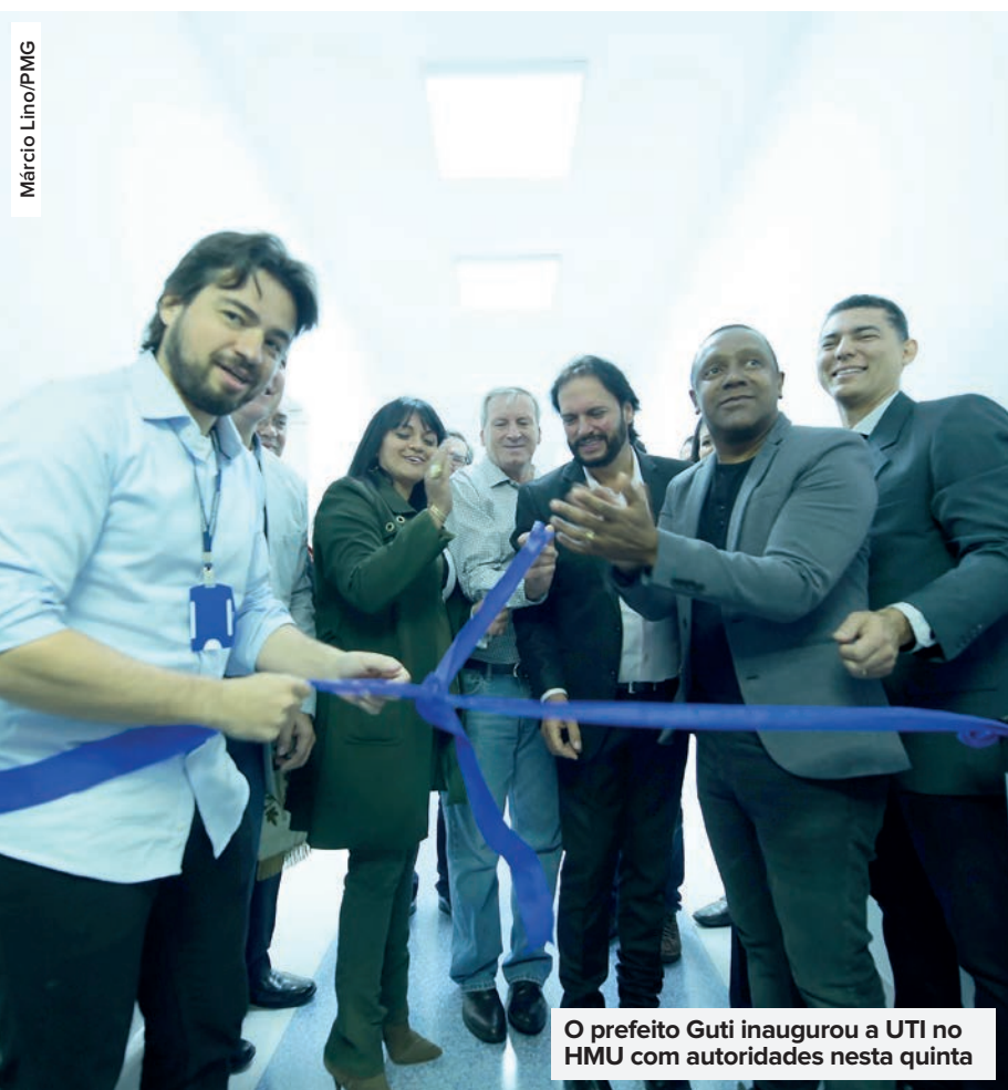
O prefeito Guti inaugurou a UTI no HMU com autoridades nesta quinta

Prefeitura estuda formas de cobrar os grandes devedores de IPTU e ISS